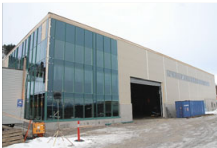
Ny fabrikk: Den nye fabrikk til 35 millioner kroner vil være innflyttingsklar ved påsketider.