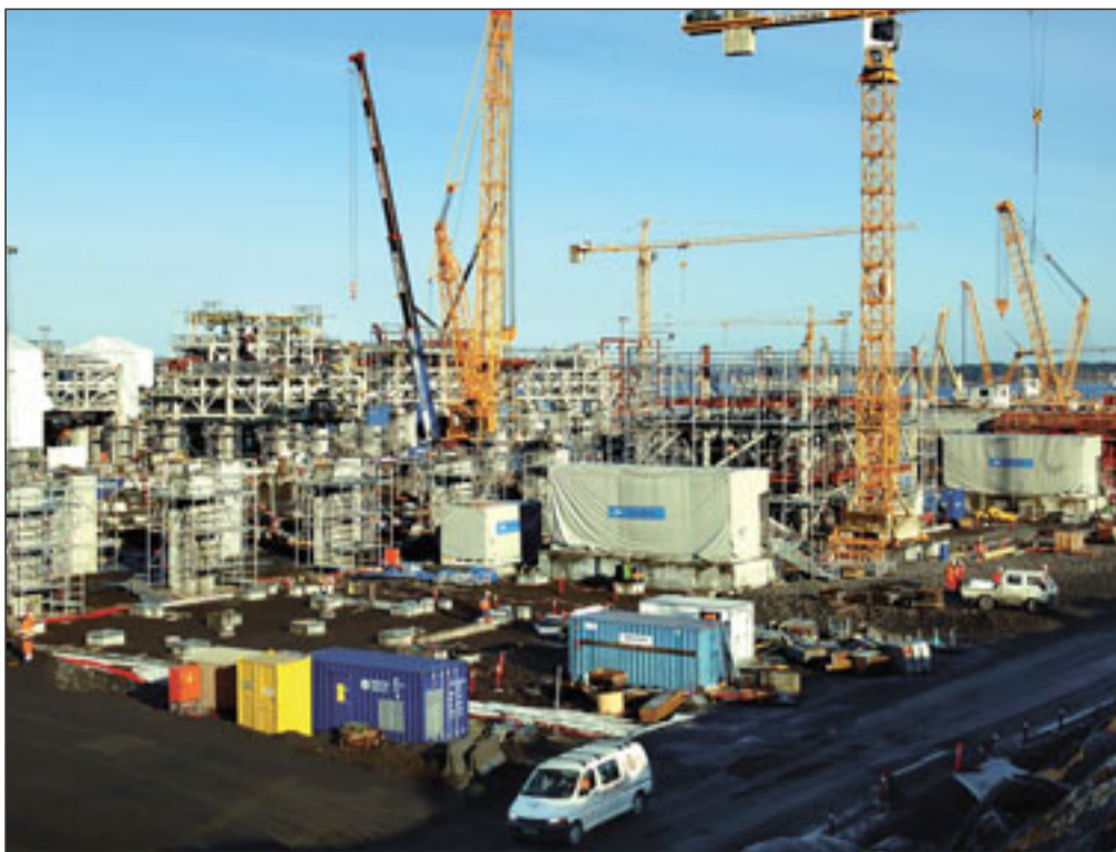
Toppår: 2006 blir toppåret for anleggsaktiviteten på Nyhamna, med over 3.000 anleggsarbeidere i høst.