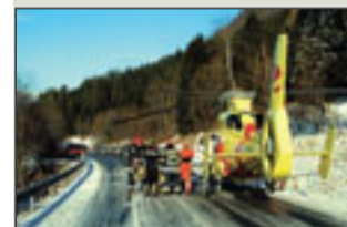
Hoemstranda i Tresfjord.