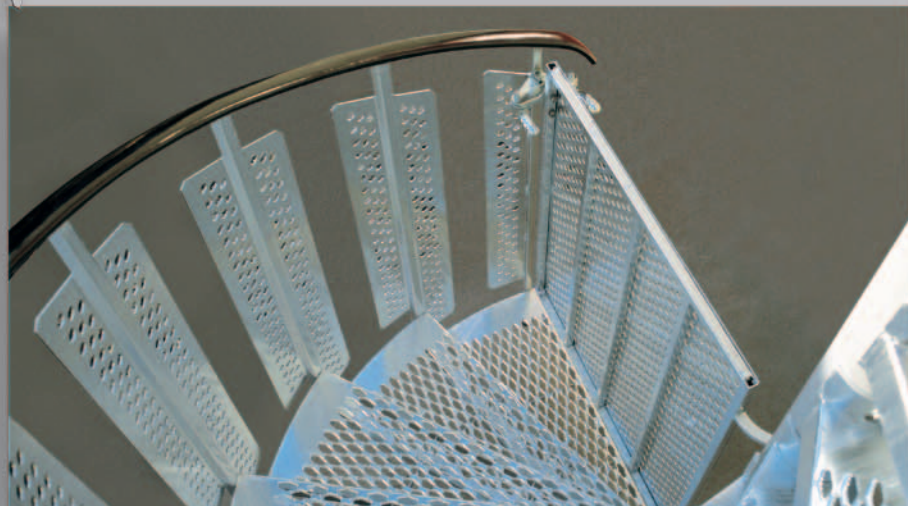
Bildet viser trapp med port som ekstrastyr, alt i varmforzinket utførelse.