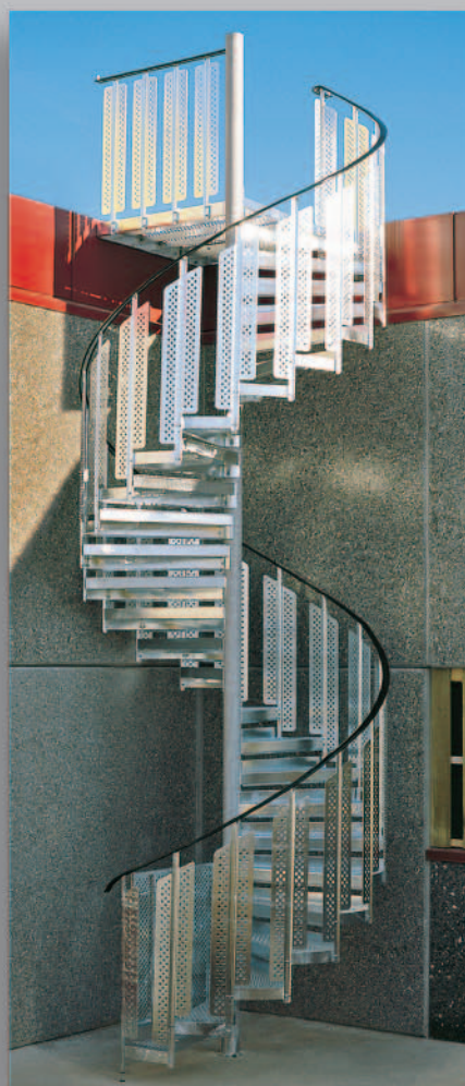
Modellen tilbys i radius 800, 900, 1000, 1100, 1200 og 1300 mm.

På grunn av kontinuerlig produktutvikling, forbeholder Midthaug seg retten til tekniske endringer på produktene uten nærmere varsel.