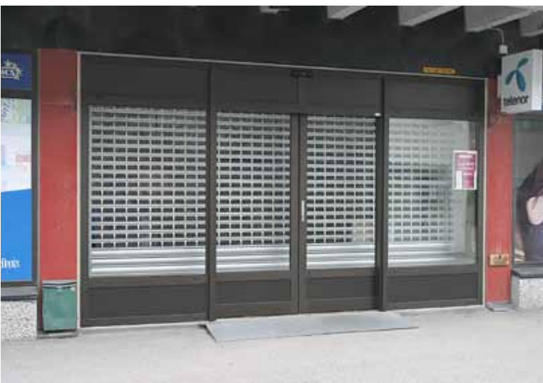
Øverst: Inngangsparti, Sjevik ungdomskole, Molde