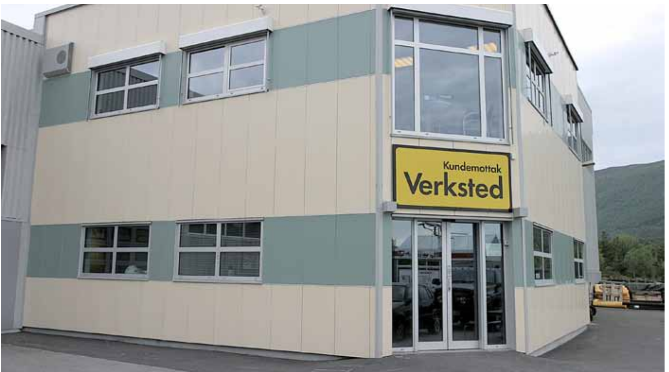
Øverst: Auto 88, Eide