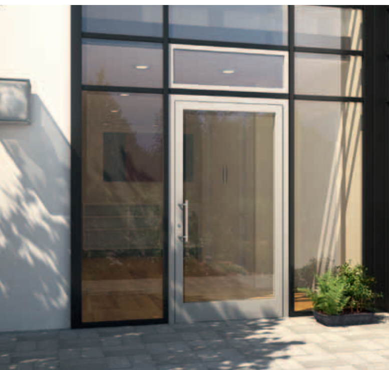
Fasade med dør